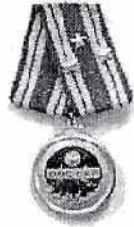
Huân chương Độc lập Hàng Nhất