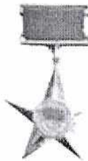
Anh hùng LLVT Nhân dân