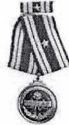
Huân chương Độc lập Hàng Ba